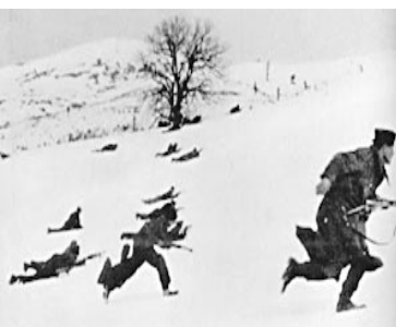
CHOREGRAPHIE DE A VICTOIRE

grecque passe à la contre-offensive. Après des violents combats la Grèce occupait la majeure partie du sud de l'Albanie, pays sous autorité italienne depuis le début de l'année 1939. La victoire surprise grecque contre les italiens fut la première victoire