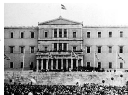
LA CELEBRATION DE LA LIBERATION A ATHENES

En octobre 1944, Athènes fut libérée. C'est avec enthousiasme que la nation réjouie accueillit les armées grecque et britannique. Malheureusement les britanniques ne respectèrent pas la volonté du peuple Grec pour une indépendance nationale. En décembre 1944 les troupes du Général Skoby, chef de l'armée britannique en Grèce, tente de maîtriser une manifestation de EAM en utilisant la force. Il y a des morts et des nombreux blessés parmi les manifestants. Le centre d'Athènes se transforme en champs de bataille. L'EAM, majoritaire dans le pays, tente de prendre le contrôle de la capitale. Le gouvernement de G. Papandhréou, soutenu par ses protecteurs Britanniques, de l'autre côté ne cède pas. Le conflit est inévitable. C'est le début d'une période des tensions et d'anomalie jusque à la déclaration de la guerre civile en 1946.