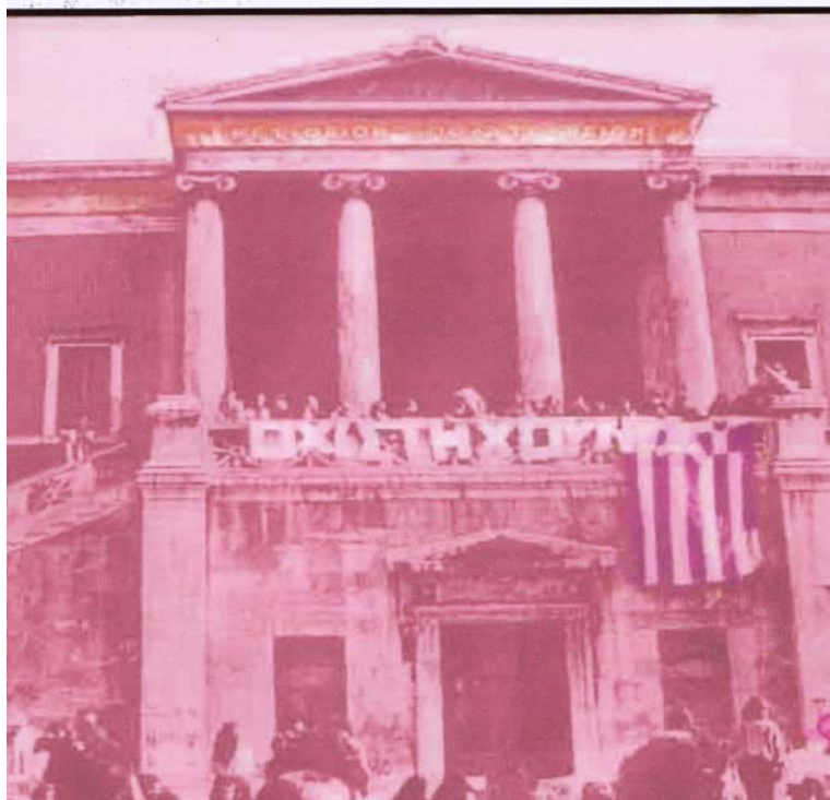
L'école polytechnique symbole de la résistance

Pour le régime il n' y a qu'une seule solution: la répression violente. L' armée va intervenir. Tard dans la nuit du vendredi 16 novembre, les chars blindés sont devant l'entrée de l'école polytechnique et chassent tous opposant à l' extérieur. Les étudiants intérieurs décident de résister.