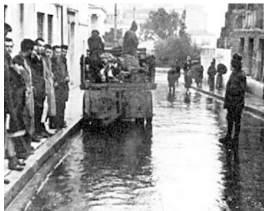
RAMASSAGE DES MORTS, HIVER 1942

La première année d'occupation fut extrêmement difficile. L'administration nazie confisquait toutes les ressources, provoquant sciemment la disette. Au cours de l'hiver 1942, les populations urbaines connurent une terrible famine et l'on estima à 250 000 le nombre de personnes mortes de faim dans les rues d'Athènes. Une