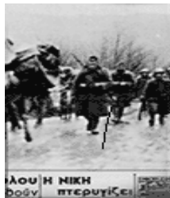
VERS LE FRONT, DANS LE FROID

ultimatum a donné un prétexte à Mussolini d'attaquer militairement la Grèce. L'armée italienne, supérieure en matériel, technologie mais surtout plus nombreuse, se voyait dans quelques jours boire le café matinal au pied de l'acropole. L'armée grecque défendit avec courage et efficacité. La mobilisation du peuple grec est sans précédent. L'offensive italienne échoua. Dans les montagnes enneigées de Pindus l'armée