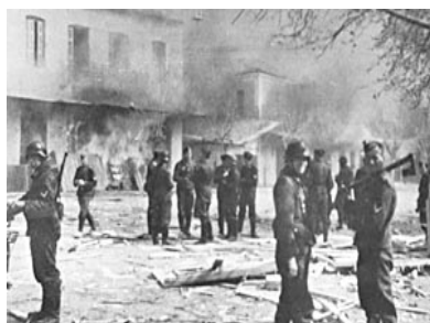
LA DESTRUCTION DE DISTOMON 1944