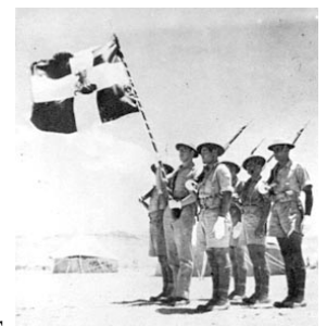
L'ARMÉE EN EGYPTTE

En Crète, des régiments grecs et britanniques, aidés activement par la population, livrèrent une féroce résistance (Bataille de Crète) en mai 1941. Des forces aéroportées de Nazis, utilisées pour la première fois dans l'histoire militaire, remportèrent la bataille. La victoire est amère, une victoire à la Pyrrhus. Ils ont perdu du temps et des forces. Les opérations contre l'Union soviétique vont être repoussées de quelques mois fatidiques. Le gouvernement grec et quelques unités qui restaient des armées de terre, de mer et de l'air suivirent les britanniques en retraite en Égypte et continuèrent à se battre jusqu'à la victoire finale des Alliés. Les recrutés sont les grecs de la diaspora et des jeunes hommes qui avaient rompu avec la Grèce.