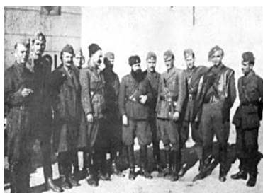
REUNION DES KAPETANIOS A LAMIA A 1944