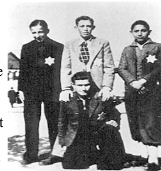
JEUNES JUIFS GRECS SALONIQUE 1943

la Grèce subit de très lourdes pertes humaines et matérielles. Sur le plan humain, on estime à 687 000 le nombre total de morts. L'infrastructure, quant à elle, fut détruite par les combats, les bombardements, le sabotage et le pilage. Mais le pire était à venir. On savait que les groupes de résistance étaient armés et déjà impliqués dans leur conflit de politique interne. En 1944, les gouvernements royal britannique et grec envisagèrent une confrontation armée avec le front national de libération (EAM), dont l'influence s'étendait à toutes les zones rurales et à la majorité des villes principales, bénéficiant alors du soutien de la plupart des Grecs. En octobre 1944, Athènes fut libérée. C'est avec enthousiasme que la nation réjouie accueillit les armées grecque et britannique. Malheureusement les britanniques ne respectèrent pas la volonté du peuple Grec pour une indépendance nationale. En décembre 1944 les troupes du Général Skoby, chef de l'armée britannique en Grèce, tente de maîtriser une manifestation de EAM en utilisant la force. Il y a des morts et des nombreux blessés parmi les manifestants. Le centre d'Athènes se transforme en champs de bataille. L'EAM, majoritaire dans le pays, tente de prendre le contrôle de la capitale. Le gouvernement de G. Papandhréou, soutenu par ses protecteurs Britanniques, de l'autre côté ne cède pas. Le conflit est inévitable. C'est le début d'une période des tensions et d'anomalie jusque à la déclaration de la guerre civile en 1946.